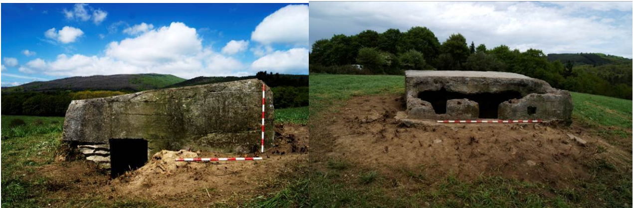
Fortín occidental (izda.) y fortín oriental (dcha).