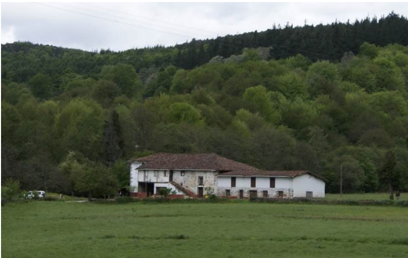
Vista exterior de la ermita de Santa Engracia.