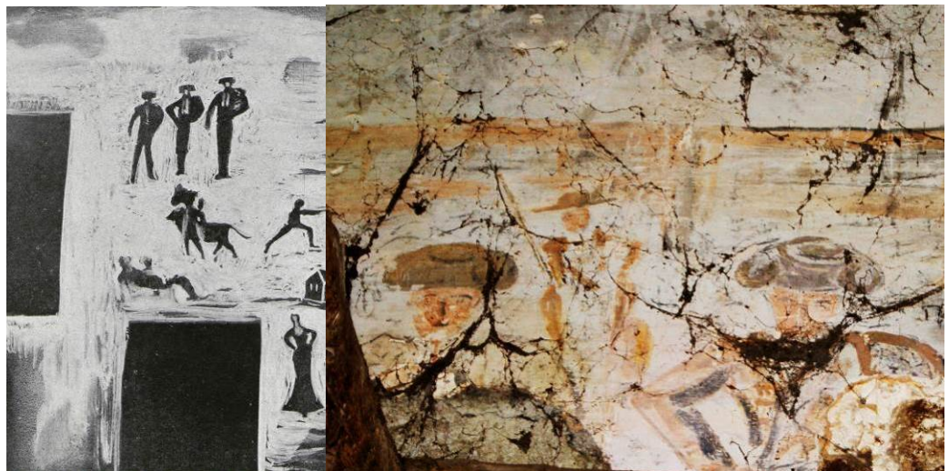
Imagen de los dibujos en el interior de la ermita en 1938 (izda.) e imagen actual (dcha.).