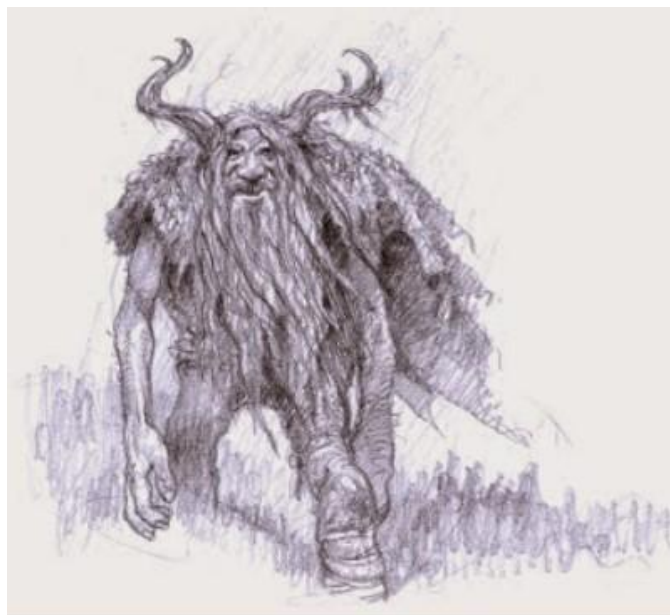
Basajaun por Larry MacDougall

Dentro del ámbito de la mitología vasca, destacan numerosos seres que han protagonizado estas narraciones: Basajaun , vinculado al misterio y la energía del bosque; los Gentiles , dotados de una fuerza sobrehumana; Mari , diosa de la naturaleza y representación de la madre tierra ( Ama Lurra ); Sugaar , asociado al mal o a la muerte; y las lamias o sorgiñe (brujas), que ocupan un lugar central en muchas leyendas. Cuando se trata de figuras masculinas, aparecen personajes como mamures, prakagorris o genios. La presencia de estos seres se refleja incluso en